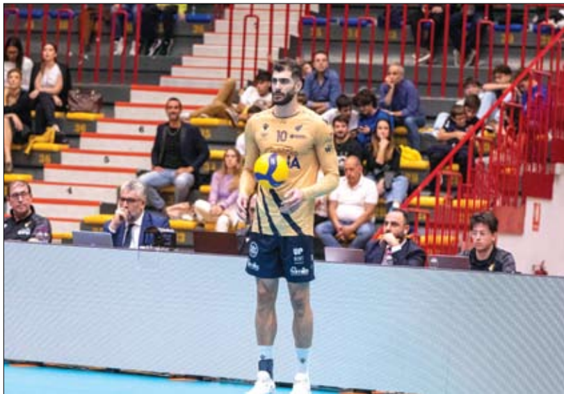
وی درمورد شرایط کلی تیم ورونسا در این فصل آمده بودند و نیاز به استراحت و ریکاوری داشتند.

رفته رفته تیممان شکل اصلی خود را پیدا کرد و بازی‌های منسجمی ارائه کردیم. اگر بتوانیم این روند را تا پایان فصل حفظ کنیم فکر می‌کنم شاهد اتفاقات خوبی باشیم. پشت خط زن ایرانی تیم والیبال ورونای ایتالیا عنوان کرد: لیگ ایتالیا واقعا سخت و غیرقابل پیش‌بینی است. سال گذشته لوبه با چند شکست به عنوان قهرمانی رسید و پروجا که در مرحله مقدماتی بدون شکست بود نتوانست قهرمان شود. بدون شک هر تیمی که خودش را باور داشته باشد می‌تواند به موفقیت برسد. به نظر من لیگ ایتالیا با کل دنیا فرق می‌کند؛ من مواردی را در ایتالیا دیدم و تجربه کردم که تا به حال ندیده بودم.