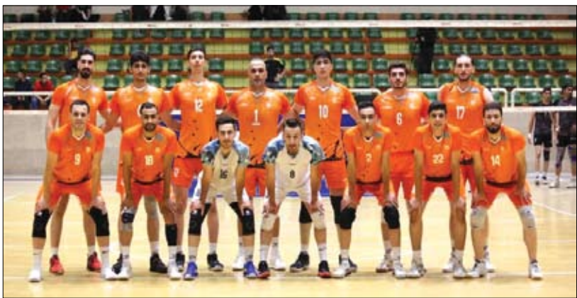
صنعتگران امید تهران ۳ - مس سونگون ۲ مس سونگون ۳ - مس کرمان صفر

شهرداری فردیس صفر - مس سونگون ۳ مس سونگون ۳ - گل گهر سیرجان صفر مس سونگون ۱ - مس شهر بابک ۳ کاسپین پره سر گیلان صفر - مس سونگون ۳ نام آوران تنکابن ۳ - مس سونگون ۲ مهرگان نور ۳ - مس سونگون ۱ مس سونگون ۳ - کریمه قم ۲ مس سونگون ۳ - صنعتگران امید تهران ۱ مس سونگون ۳ - توپکا بایلسر صفر شهرداری فردیس صفر - مس سونگون ۳ نیروی زمینی تهران ۱ - مس سونگون ۳ گل گهر سیرجان ۳ - مس سونگون ۱ مس کرمان ۱ - مس سونگون ۳ مس شهر بابک ۳ - مس سونگون ۱ مس سونگون ۳ - کاسپین پره سر گیلان صفر مس سونگون ۳ - نام آوران تنکابن صفر