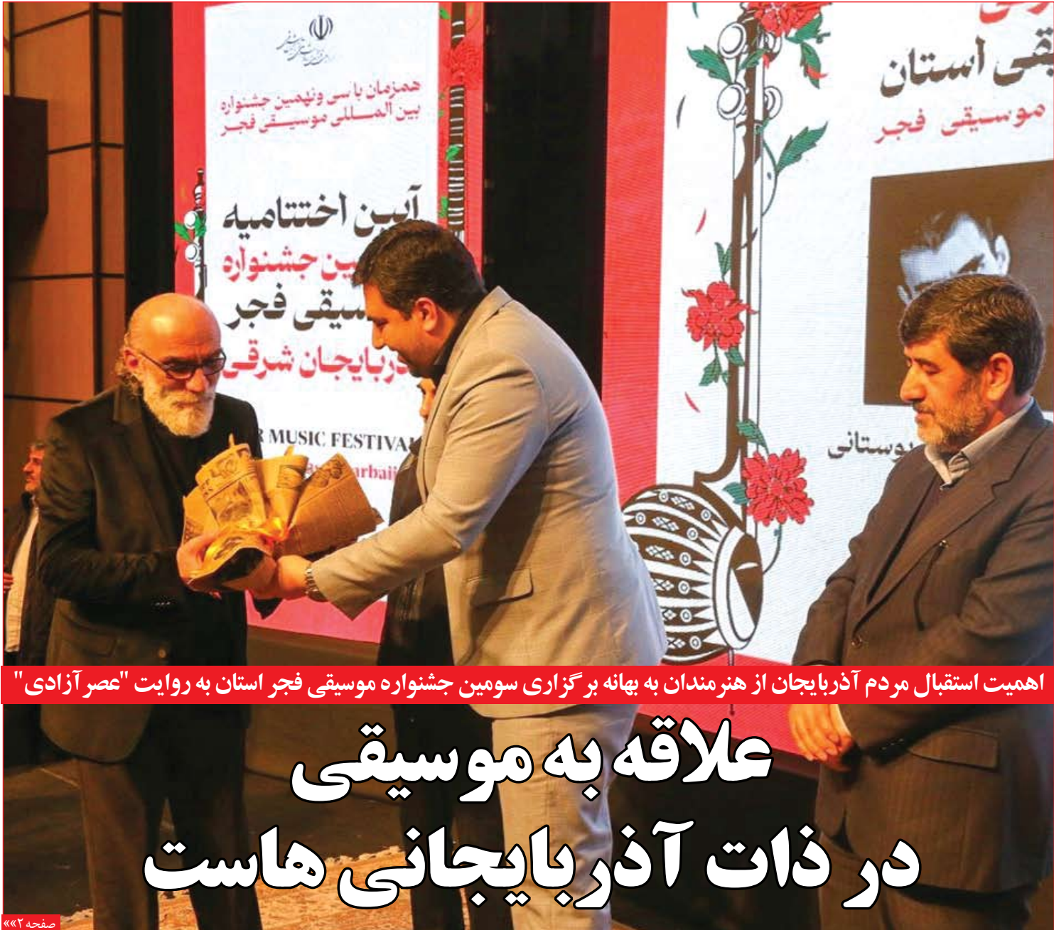
اهمیت استقبال مردم آذربایجان از هنرمندان به بهانه برگزاری سومین جشنواره موسیقی فجر استان به روایت "عصر آزادی"