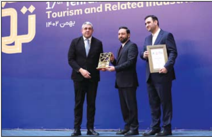
اهدای تندیس ثبت کندوان توسط دبیر کل سازمان جهانی گردشگری به استاندار آذربایجان شرقی

بدین ترتیب، از مزایای انتخاب شدن کندوان یا همان گون دوغان یا کندجان به عنوان روستای جهانی گردشگری می‌توان به معرفی آن در سطح بین‌المللی به عنوان نمونه‌ای برجسته از یک مقصد گردشگری روستایی، ارائه گواهی امضا شده توسط دبیرکل سازمان جهانی گردشگری، دارا شدن فضایی برای تبادل تجربیات و آموزش، امکان شرکت در رویدادهای مرتبط با توسعه روستایی و گردشگری و در نهایت معرفی کشور صاحب روستا در ابعاد زوایای مختلف گردشگری اشاره کرد که به طور حتم برای منطقه آذربایجان مشرّم خواهد بود و اگر سنگ اندازی خاصی صورت نگیرد نویدبخش روزهای گرمی در طبیعت کوهستانی و سرد کندوان خواهیم بود.