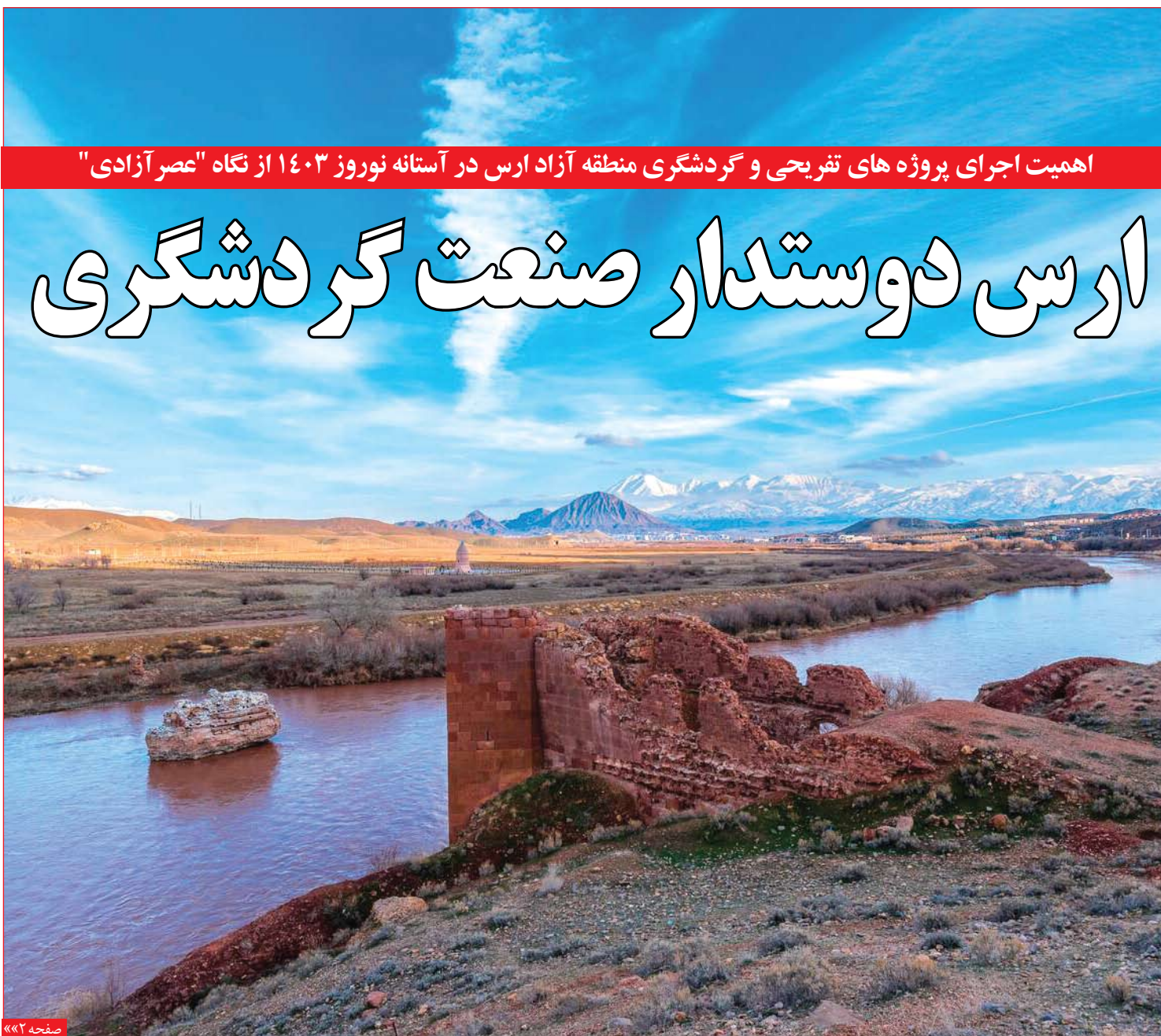
اهمیت اجرای پروژه های تفریحی و گردشگری منطقه آزاد ارس در آستانه نوروز ۱۴۰۳ از نگاه "عصر آزادی"