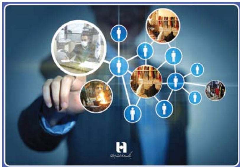
عصر آزادی / سرویس بانک و بیمه: بانک صادرات ایران به منظور پشتیبانی از کسب و کارهای کوچک و متوسط و کمک به استقلال مالی و معیشتی سرپرستان خانوار، در ۱۱ ماه