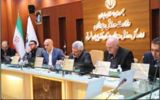
درد. وی افزود: خوشبختانه ورزشکاران خوبی هم از نظر فنی و از نظر اخلاقی داریم که پتانسیل های این استان هستند.

ستوده نژاد خاطرنشان کرد: امیدواریم علاوه بر تبریز در سایر شهرستانها هم این رشته را ایجاد کنیم. از تلاش های رئیس این هیات هم تشکر کنم که زحمات زیادی برای پیشرفت اسکواش کشیدند. در ادامه عزیزی پور رئیس فدراسیون اسکواش گفت: فضایی که در این استان وجود دارد قابل تقدیر است و از رئیس هیات و مدیرکل ورزش و جوانان استان تشکر می کنم. وی تصریح کرد: باوجود اینکه استعداد های خوبی در این استان وجود دارد ولی نباید قانع بود بلکه از تمامی این ظرفیت ها بایستی بهره مند شد.