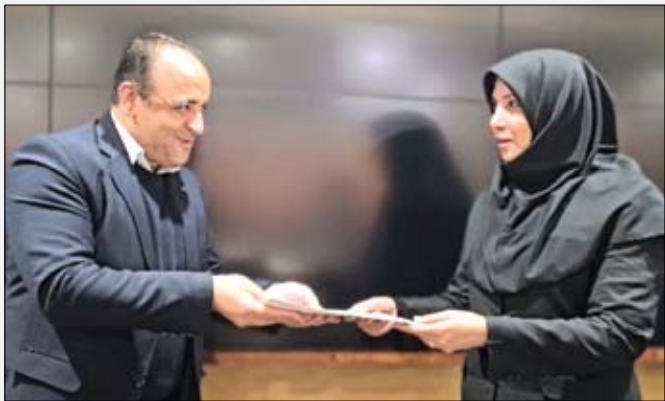
منطقه ۳ مدیران روابط عمومی استان های وزارت جهاد کشاورزی را تشکیل داده اند.