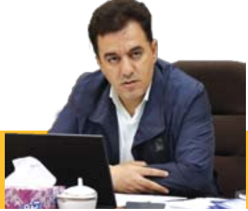
اتصال قرامنگ به بازار تبریز با بهره‌برداری از خط ۲ مترو