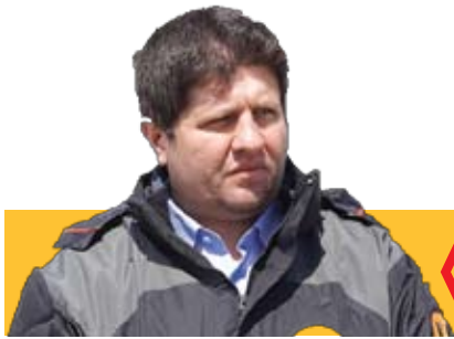
بهره مندی ۴۵۱ هزار نفر از خدمات نروزی هلال احمر