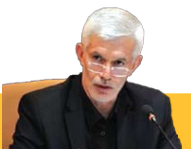
کلیه مسابقات ورزشی لغو شد