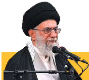
رئیس عزیزی خستگی نمی‌شناخت

سانحه سقوط هلی کوپتر در آذربایجان شرقی از نگاه "عصر آزادی"