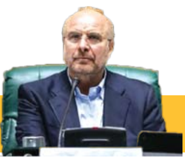
قالیباف رئیس مجلس دوازدهم شد