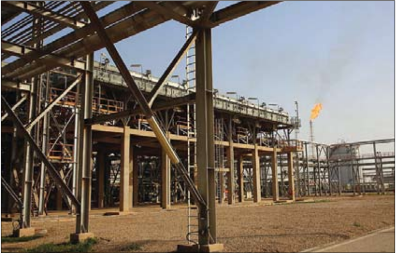
بین‌المللی نفت و حضور ۲۵۰ شرکت خارجی و ۵۰۰ شرکت داخلی در این نمایشگاه بیان کرد: اروندان با اشاره به ظرفیت‌های خوب نمایشگاه

توانمندی شرکت‌هاست، بنابراین این مدیریت با برنامه‌ریزی و تشکیل گروه‌های مختلف با شرکت‌های مرتبط، با حوزه نفت مذاکره و از غرقه آن‌ها بازدید کرد. ۵ هزار قلم کالای نفتی در اروندان کدگذاری و استانداردسازی می‌شود رفیع با اشاره به عملکرد شرکت نفت و گاز اروندان در حوزه ساخت و تأمین کالا افزود: حدود ۵ هزار قلم کالای مصرفی این شرکت در آزادگان شمالی در اختیار پیمانکار بود که همه آن‌ها به سیستم نفت برگردانده و قیمت‌گذاری شد و در آینده‌ای نزدیک نیز کدگذاری و استانداردسازی می‌شوند. وی با اشاره به اهمیت فعالیت‌های علمی در شرکت‌های دانش‌بنیان برای توسعه صنعت نفت در کشور گفت: امیدوارم امسال بتوانیم این آمار و ارقام را در شرکت نفت و گاز اروندان افزایش دهیم و ارتباط بیشتری با شرکت‌های دانش‌بنیان داشته باشیم. همان‌طور که مقام معظم رهبری فرمودند امسال سال جهش تولید با مشارکت مردمی است و تحقق این شعار را از طریق اعضای قرارداد با شرکت‌های خصوصی دنبال می‌کنیم.