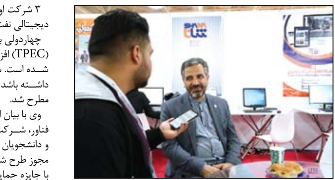
تقاضا از شرکت‌های دانش‌بنیان دریافت کرد. رئیس تدارکات و امور کالای شرکت نفت و گاز اروندان با اشاره به ظرفیت‌های خوب نمایشگاه

شرکت اول رقابت شهید تندگویان در اولویت واگذاری میدان‌های دیجیتال نفت و گاز چهاردولی با اشاره به رویداد رقابتی مهندسی نفت شهید تندگویان (TPEC) افزود: این رویداد نوآورانه در دانشگاه صنعت نفت بنیان‌گذاری شده است. شرکت ملی نفت بنا دارد در حوزه هوش مصنوعی فعالیت داشته باشد و با توجه به خلأ این فناوری در کشور، پیشنهاد این رقابت مطرح شد. وی با بیان اینکه تاکنون ۱۳۰ طرح از شرکت‌های دانش‌بنیان و نوآور و فناور، شرکت‌های دانشگاهی و گروه‌های دانشگاهی با محوریت استادان و دانشجویان دریافت کرده‌ایم، ادامه داد: با مکاتبه با بنیاد ملی نخبگان، مجوز طرح شهید بابایی (نخبگان مورد حمایت) را گرفته‌ایم تا افراد برتر با جایزه حمایتی این طرح قرار گیرند. همچنین با تفاهمی که با شرکت ملی نفت داشتیم، سه شرکت نخست در اولویت واگذاری میدان‌های دیجیتال نفت و گاز قرار می‌گیرند. رئیس دانشگاه صنعت نفت با اشاره به اینکه نمایشگاه بین‌المللی نفت، امسال باشکوه‌تر از پارسال برگزار شد، بیان کرد: افزایش قابل توجه حضور شرکت‌های داخلی و خارجی نشان‌دهنده اهمیت و جایگاه این رویداد است و شبکه‌سازی و تعاملی که در نمایشگاه بین‌المللی نفت تهران شکل می‌گیرد، به پیشرفت صنعت نفت کمک می‌کند. چهاردولی در پایان با بیان اینکه مذاکره‌های مطلوبی برای توسعه همکاری‌ها با شرکت‌های مختلف در بالادست و پایین‌دست صنعت نفت و شرکت‌های بین‌المللی انجام شده است، گفت: بخشی از این مذاکره‌ها در آینده به قرارداد تبدیل می‌شوند.