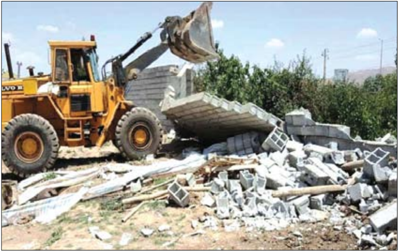
کشاورزی تجاوز به حقوق همه مردم به ویژه نسل آینده این کشور است تأکید کرد: هر گونه تصرف و ساخت و سازه‌های غیرمجاز در زمین های کشاورزی موجب اخلال در خودکفایی کشور در بخش کشاورزی

وی در ادامه با اشاره به زندگی ادبی پربر این شاعر نامی بیان داشت: میرزا احمد داووشی(۱۳۵۹-۱۲۷۹ه ش) شاعر شیرین‌سخن، نکته‌سنج، زیباسرا، زیبایی‌بن و فصیح واژه است که