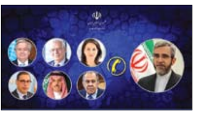
وفوری جامعه بین المللی برای توقف جنایات رژیم اشغالگر در فلسطین تاکید نمود. در خصوص

تحولات منطقه و افزایش تنش ابراز نگرانی شد. سرپرست وزارت خارجه افزود: جمهوری اسلامی بر این نظر است که آثار فاجعه بار گسترش احتمالی تنش و درگیری در منطقه ناشی از رفتار غیرمسئولانه آمریکا و پشتیبانان غربی صهیونیست ها است. باقری تصریح کرد: امروز آمادگی ملت های منطقه و جبهه مقاومت برای مقابله با تجاوزات رژیم صهیونیستی بیش از هر زمان دیگری است و مسئولیت بحرانی دیگر مستقیماً متوجه حامیان غربی رژیم است.