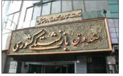
فرایند انحصار وراثت تا پایان شهریورماه سال جاری تمدید شود.

براین اساس، بازنشستگان می توانند تا ۳۱ شهریورماه ۱۴۰۳ اسناد بستری مربوط به قرارداد سال گذشته (آیه سازمان حافظ) را به شعب و نمایندگی های این شرکت تحویل دهند. براساس اعلام اداره کل روابط عمومی و امور بین الملل صندوق بازنشستگی کشوری، پس از بررسی اسناد و تایید توسط شرکت مربوطه، بهانه اسناد طبق قوانین و در سقف پوشش های تعیین شده در فرآیند پرداخت از سوی این صندوق قرار خواهد گرفت.