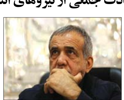
وزیر کشور در نشست خبری

اشرار جنایت کار که در حین صیانت از آرای مردم مورد حمله ناجوانمردانه قرار گرفت، موجب تأثر و تألم فراوان شد. وی در ادامه این مطلب آورده است: ضمن تسلیت این حادثه ناگوار به فرماندهی کل نیروهای مسلح، فرماندهی کل انتظامی، نیروهای فراجا و ملت غیور ایران و خانواده محترم شان، از درگاه خداوند رحمان برای بازماندگان، صبر جمیل و اجر جزیل و برای شهیدان والا مقام، علو درجات مسئلت می نمایم.