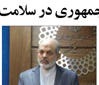
وزیر کشور در نشست خبری

خودشان را در معرض رأی قرار دهند، می خواهم که مانند دور قبل با رعایت اخلاق شاهد انتخابات خوب در تراز جمهوری اسلامی باشیم و تمام جهان نظاره گر باشد که انتخابات مهم ما چگونه در کمال صحت و سلامت انجام شد. وزیر کشور ادامه داد: برای مرحله دوم در خارج از کشور تعرفه ها از قبل با این احتمال که ممکن است انتخابات به مرحله دوم بینجامد، به سفارت های ندادند علی رغم اینکه صداي دموکراسی آنها بالا است، مردم رأی دهند. حتماً وزارت خارجه رایزنی خواهد کرد اما بعد می دانیم طبق شناختی که از آنها داریم و نقشی که در حمایت از صهیونیسم دارند، در دور دوم انتخابات هم این کار را انجام و اجازه رأی دادن به مردم ما دهند.