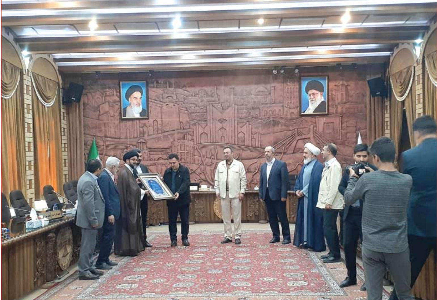
اهم مباحث نشست علنی شماره ۲۰۲ پارلمان شهری تبریز به روایت "عصر آزادی"

تلاش برای انتقام سخت از قطر و ۶ تایی کردن طوفان زرد آسیا