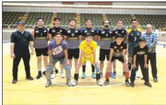
فروردین ماه در حال برگزاری بود به مرحله فینال خود رسید. عصر آزادی/فرهادفراهادیپور؛ تیم بازرگانی مهدی نژاد که به عنوان

برنامه فینال مسابقات متعاقبا اعلام خواهد شد. دیگر تیم راه یافته به فینال و کسب سهمیه کشوری تیم والیبال جوانان فجر تبریز وابسته به باشگاه مقاومت می باشد.