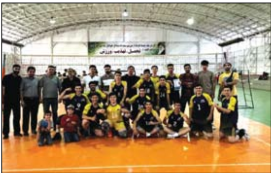
عصر آزادی/اسرویس ورزشی: مسابقات قهرمانی جوانان استان آذربایجان شرقی که با حضور ۲۳ تیم از تمام نقاط استان از