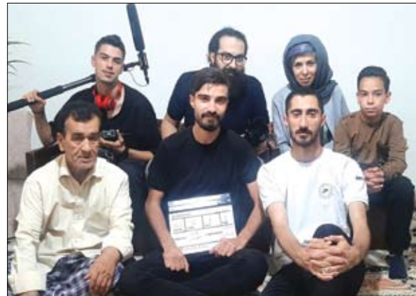
نویسنده، کارگردان و تهیه‌کننده: شقایق عوض زاده برنامه‌ریز: آتوسا عسگری

منشی صحنه: عطیسه سهلانی دستیار اول کارگردان: نوید نوری دستیار دوم کارگردان: رضا بجاتی عکاس پشت صحنه: شیمیا کبیری مدیر فیلمبرداری: مسعود نیک قلب، پارسا کوچکی صدا بردار: آرش باوی طراح صحنه: حمید عوض زاده طراح لباس: ملیحه سادات حسینی دلچه گرم: مهسا حیدر اهنگساز: مژده بروجردی مدیر تولید: ملیحه حسینی روابط عمومی: علی هدایتی و با تشکر از: