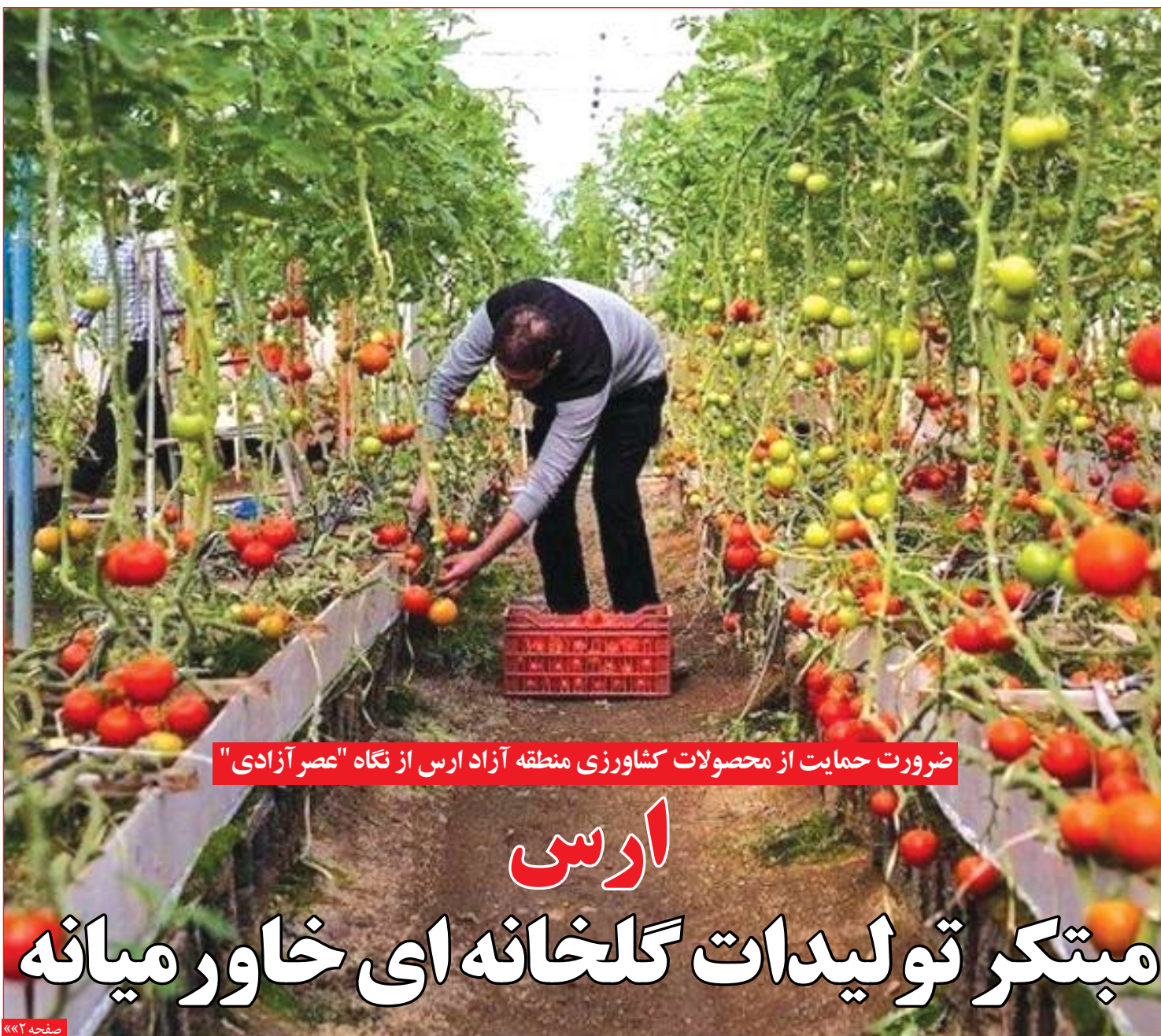
ضرورت حمایت از محصولات کشاورزی منطقه آزاد ارس از نگاه "عصر آزادی"