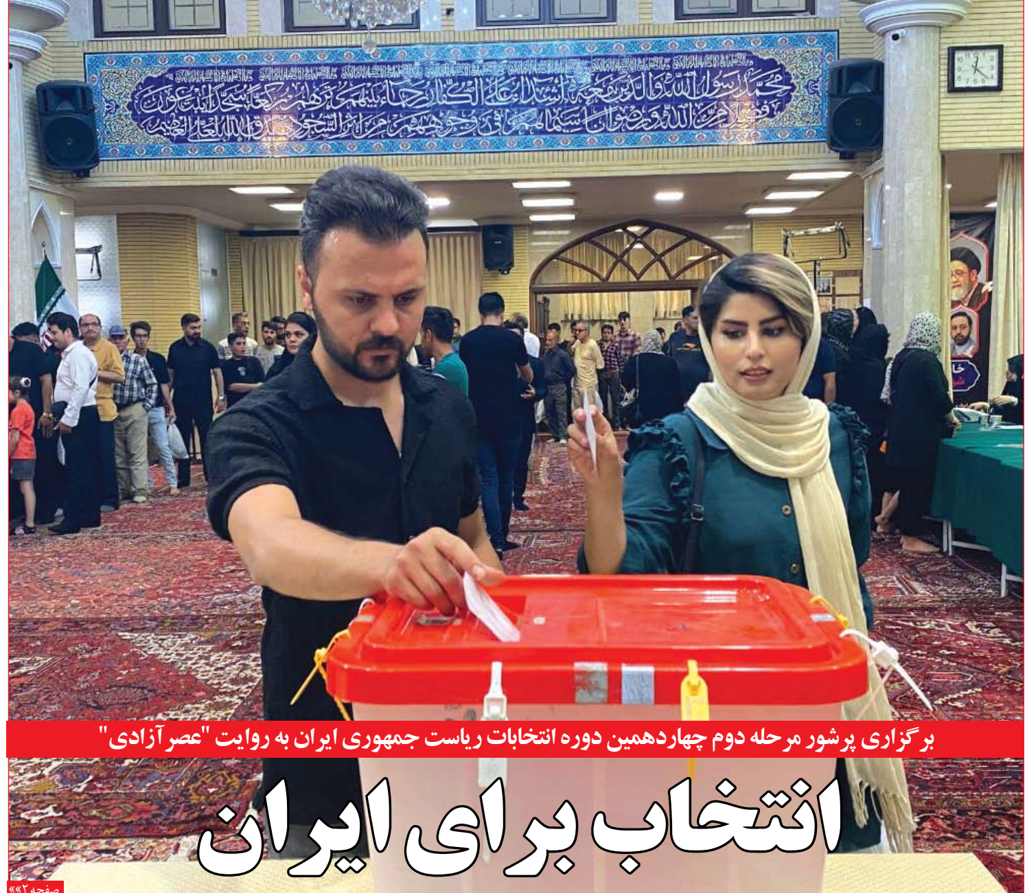
برگزاری پر شور مرحله دوم چهاردهمین دوره انتخابات ریاست جمهوری ایران به روایت "عصر آزادی"