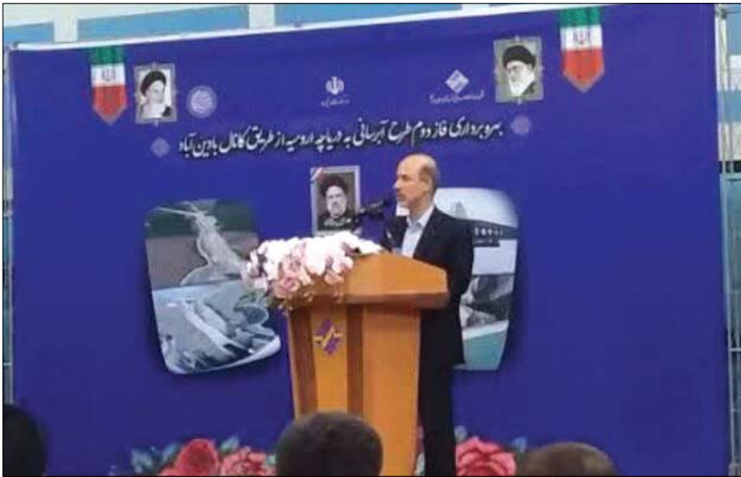
وزیر نیرو گفت: دریاچه ارومیه بهترین منبع حیات در شمال غرب کشور بوده و احیای آن جز اولویتهای هر دولتی است. علی اکبر محرابیان ۱۴ تیرماه در آیین بهره

برداری از از فاز دوم طرح آبرسانی به دریاچه ارومیه از طریق کانال بادین آباد گفت: با بهره گیری از مدیریت آب، بخشی از اهداف احیای دریاچه ارومیه را محقق کردیم و از این به بعد سالانه شاهد افزایش تراز دریاچه ارومیه خواهیم بود. وی اظهار کرد: خشک شدن دریاچه ارومیه حیات استان های همجوار و بخش قابل توجهی از کشور را با تهدید جدی رو برو می کند، لذا مدیریت منابع آب منطقه برای احیای دریاچه ارومیه به اولویت دولت سیزدهم تبدیل شد. وی خاطرنشان کرد: احیای دریاچه ارومیه نه تنها به حفظ محیط زیست و اکوسیستم منطقه