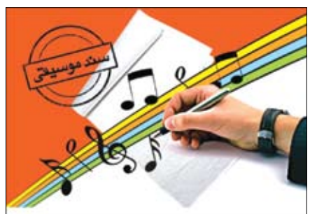
با توجه به رتبه بالای آن در مصرف محصولات فرهنگی و هنر ادامه داد: تدوین و تصویب سند ملی موسیقی از

دستاوردهای بسیار خوب رئیس‌جمهور شهید حضرت آیت‌الله رئیسی بوده است که با پیگیری‌های ایشان در شورای عالی انقلاب فرهنگی تصویب و ابلاغ شد. دبیر ستاد فرهنگی و اجتماعی شورای عالی انقلاب فرهنگی در خصوص ایرادات و اشکالات بیان شده توسط صاحب‌نظران و استادان حاضر در این نشست، گفت: مصوبات شورای عالی انقلاب فرهنگی پس از شش ماه از تصویب قابل اصلاح و ویرایش است، بر این اساس به ستاد فرهنگی اجتماعی دبیرخانه شورا ماموریت داده شد تا نظرات و دیدگاه‌های همه استادان و هنرمندان موسیقی را جمع‌آوری و اصلاحات پیشنهادی را به شورای عالی ارائه کند. شکرانی تشکیل و برگزاری منظم جلسات ستاد اجرایی