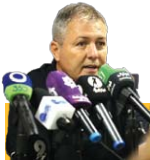
رکوردشکنی اسکوچیچ؛ اولین برد خارج از خانه تراکتور در شروع لیگ