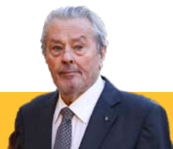
آلن دلون در گذشت