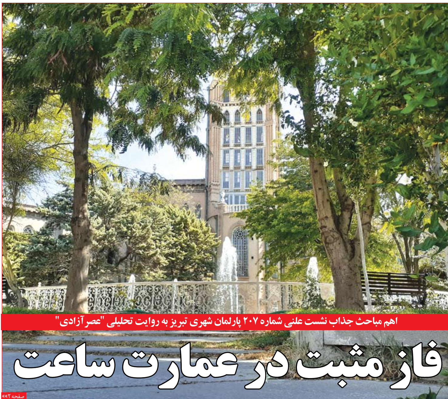
اهم مباحث جذاب نشست علنی شماره ۲۰۷ پارلمان شهری تبریز به روایت تحلیلی "عصر آزادی"