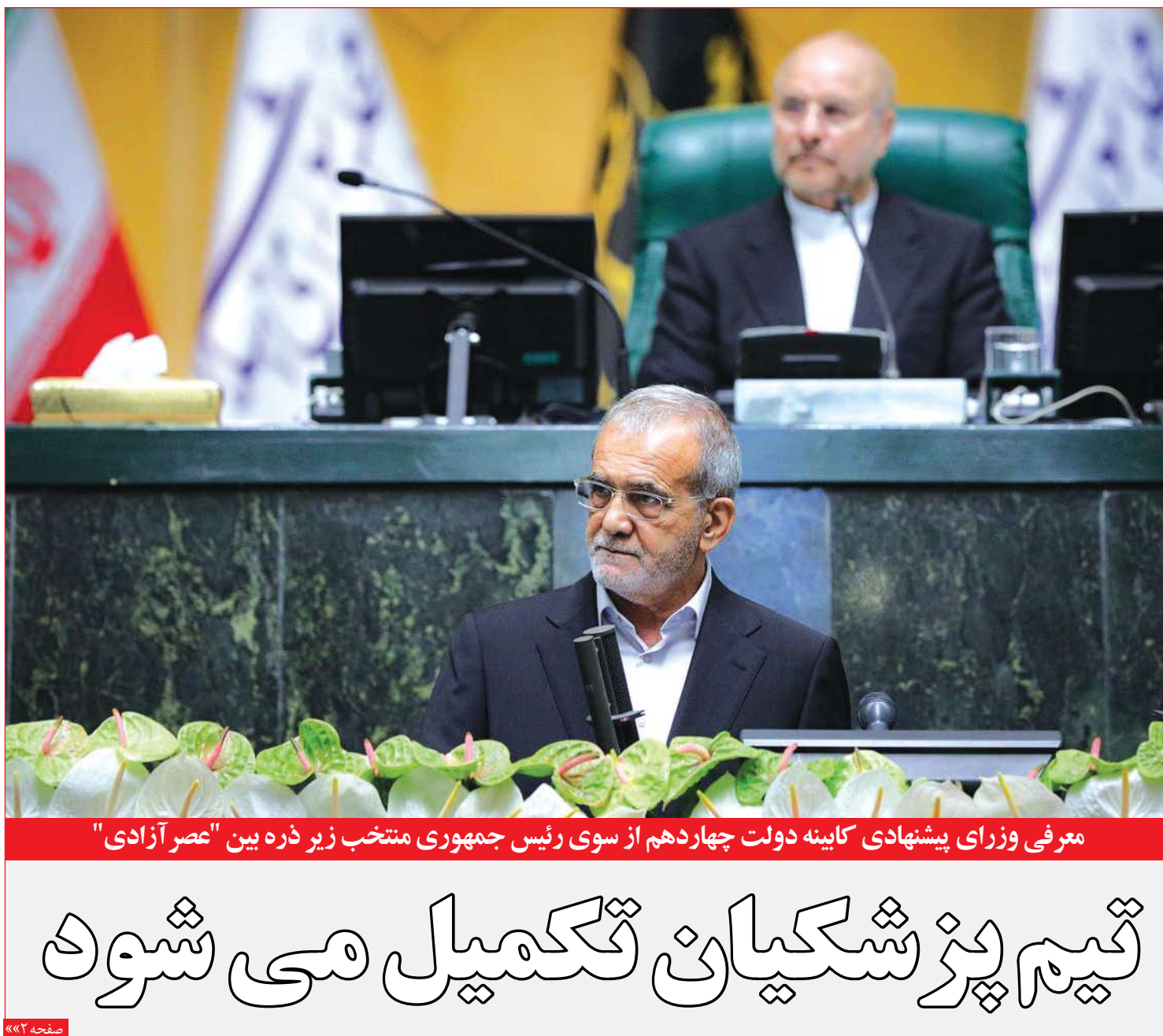
معرفی وزرای پیشنهادی کابینه دولت چهاردهم از سوی رئیس جمهوری منتخب زیر ذره بین "عصر آزادی"