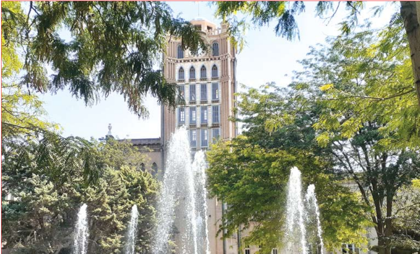
اهم مباحث جذاب نشست علنی شماره ۲۰۶ پارلمان شهری تبریز به روایت تحلیلی "عصر آزادی"