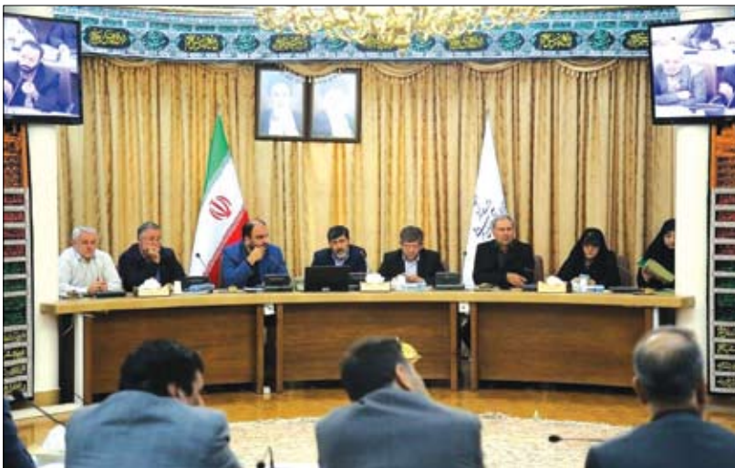
در کشور عراق حضور یابند. وی اطلاع رسانی های کافی برای ثبت نام زائران در سامانه سماح را ضروری دانست و ادامه داد: ثبت نام در سامانه سماح فرصتی برای برنامه ریزی

توسط دستگاه های مسئول است که اگر انجام نشود، مشکلاتی برای زائران و دستگاه های خدمات رسان ایجاد خواهد شد.